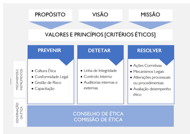
Figura I – Modelo de Integridade do Grupo AdP