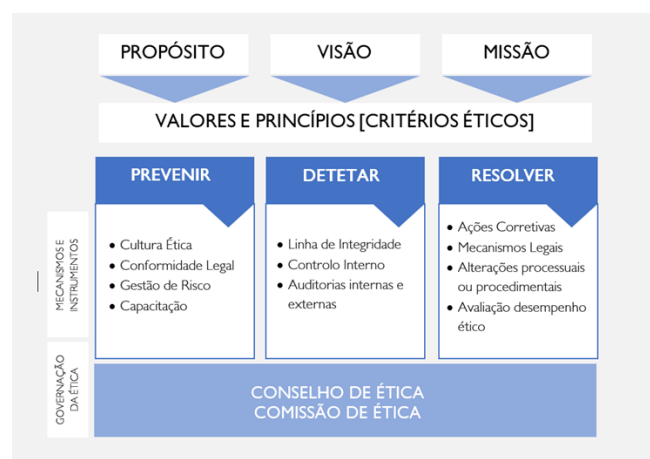
Figura I – Modelo de Integridade do Grupo AdP

O eixo “ Resolver ” integra as medidas a implementar, as metodologias de remediação para garantir a plenitude do modelo e a avaliação do desempenho ético do Grupo AdP através dos indicadores de desempenho ético.